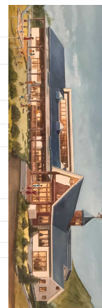
園舎構造 木造一部2階建 (2階は物置)